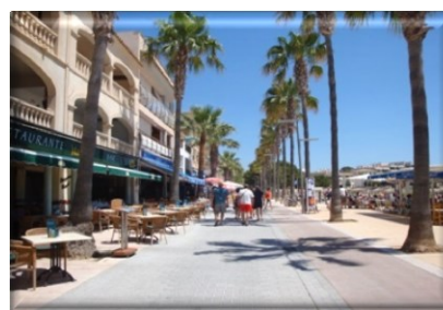
Hafenmeile Colonia Sant Jordi