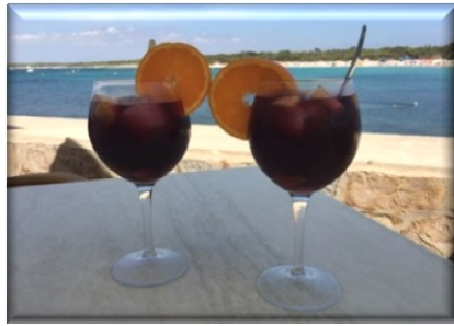
Blick von der Hotelterrasse auf's Meer

Urlaubs-Seminar auf Mallorca im Mai 2020