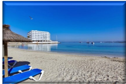
Hotel Marques direkt am Meer und dem kilometerlangen Strand